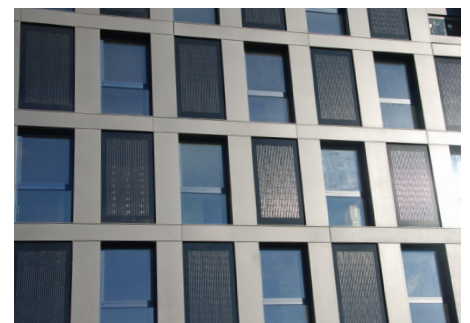
1 La résidence Silo Bleu abrite 273 logements pour étudiants. Les deux installations PV (toit et façade) génèrent ensemble 71'500 kWh/a.